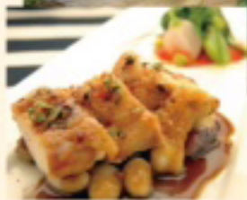
料理はイメージとなります